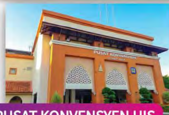
PUSAT KONVENSYEN UIS