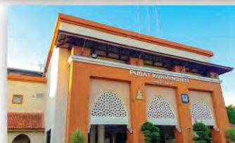
PUSAT KONVENSYEN UIS